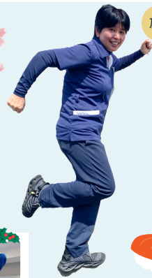
施設の日常をちょこっとご案内